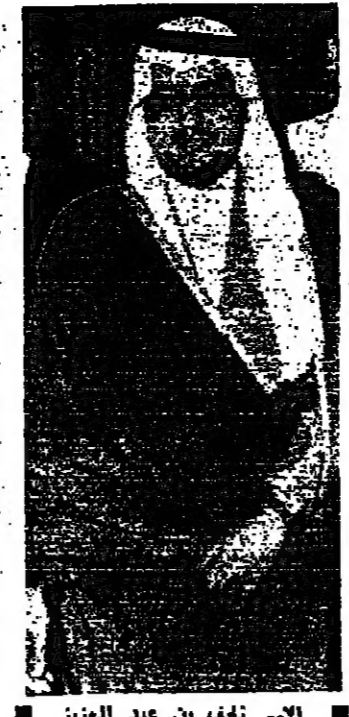
الامير نايف بن عبد العزيز

وتضم هذه اللجنة وزراء خارجية العراق وايران والجزائر ، بالإضافة الى عدد من الخبراء السياسيين والاقليميين والسعوديين من الجانبين العراقي والارمني . وكانت ثلاث لجان مخصصة من اللجنة العراقية للبحث في تحديد اجناعات المرحلة الثانية يوم الخميس تمهيدا لاجتماع اللجنة العراقية والارمنية في بغداد .